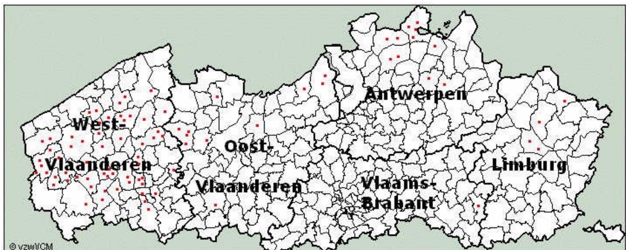
Figuur 2 De geografische situering van de diverse operationele mestverwerkingsinstallaties in Vlaanderen

vergisting als tussenstap in het verwerkingsproces, het gebruik van warmtekrachtkoppeling bij de droging of compostering van mest en verbranding. Met deze nieuwsbrief wensen we op deze actuele ontwikkeling dieper in te gaan.